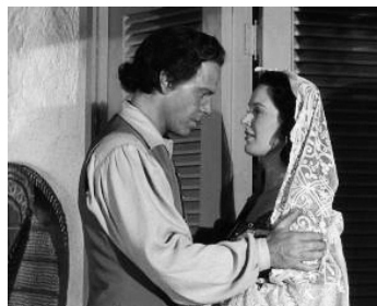
1952 LES ÉVASIONS DU CAPITAINE BLOOD (Captain Pirate) de R. Murphy avec P. Medina