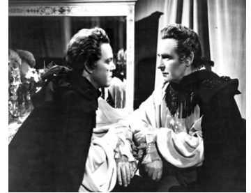
1949 LE PIRATE DE CAPRI (I Pirati di Capri) d'Edgar G. Ulmer avec Alan Curtis