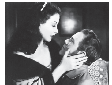
1946 LE DÉMON DE LA CHAIR (The Strange Woman) d'Edgar G. Ulmer avec Hedy Lamarr