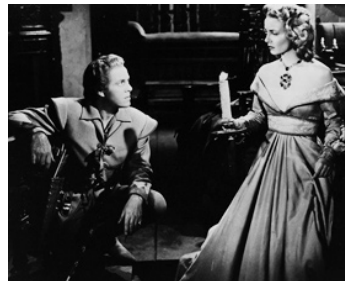
1947 LA FLÈCHE NOIRE (The black Arrow) de Gordon Douglas avec Janet Blair