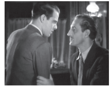
1935 UNE PLUME À SON CHAPEAU (A Feather in her Hat) d'Alfred Santell avec Basil Rathbone