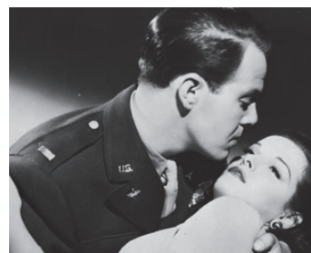
1945 L'ESCLAVE DU SOUVENIR (Young Widow) d'Edwin L. Marin avec Jane Russell