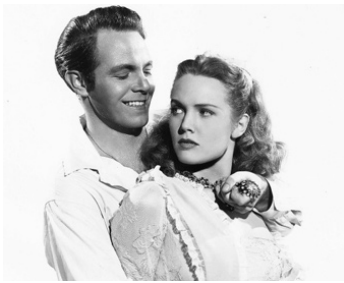
1946 LE RETOUR DE MONTE CRISTO (The Return of Monte Cristo) de H. Levin avec Barbara Britton