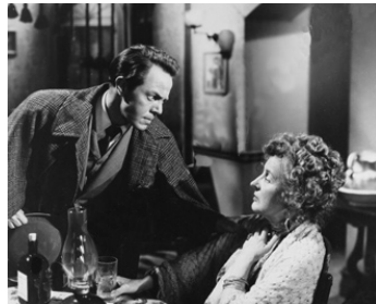
1951 LE FILS DU DOCTEUR JEKYLL (The Son of Dr Jekyll) de S. Friedman avec Benita Booth