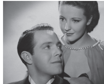
1939 MON FILS, MON FILS (My Son, My Son) de Charles Vidor avec Lorraine Day