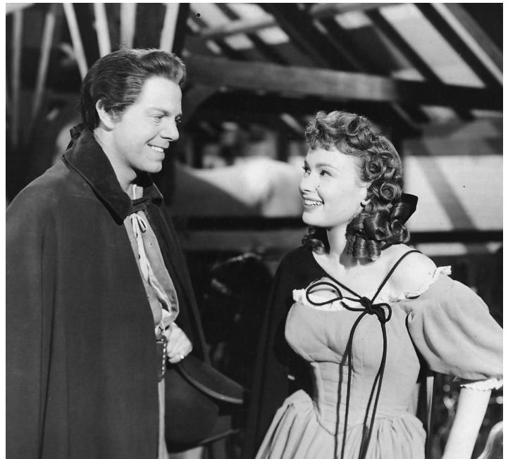
1951 LE BANDIT GENTILHOMME (The Lady and the Bandit) de Ralph Murphy avec Dona Drake