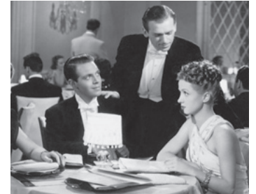
1938 LA COQUELUCHE DE PARIS (The Rage of Paris) d'H. Koster avec D. Fairbanks Jr, D. Darrioux