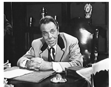
1967 JOE NAVIDAD (The Christmas Kid) de Sidney W. Pink