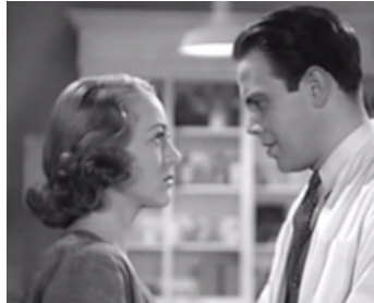
1937 DERRIÈRE LES GRANDS MURS (Condemned Women) de Lew Landers avec Sally Eilers