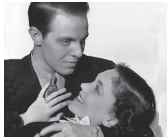
1935 LA FEMME ERRANTE (The Flame within) d'Edmund Goulding avec Maureen O'Sullivan