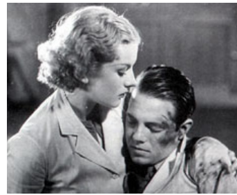
1935 AMOUR À L'ESSAI (The Love Test) de Michael Powell avec Judy Dunn