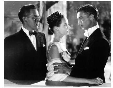
1947 L'IMPITOYABLE (Ruthless) d'Edgar George Ulmer avec Diana Lynn, Zachary Scott