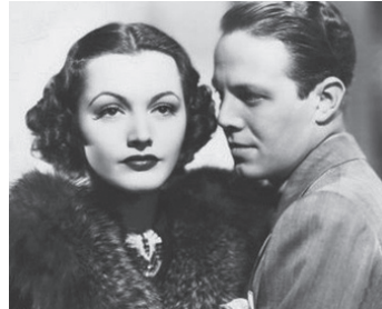
1938 LE SAINT À NEW YORK (The Saint in New York) de Ben Holmes avec Kay Sutton