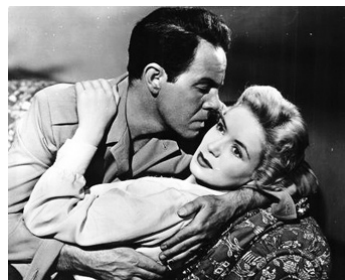
1953 COMLOT DANS LA JUNGLE (The Royal American Rifles) de L. Selander avec V. Hurst