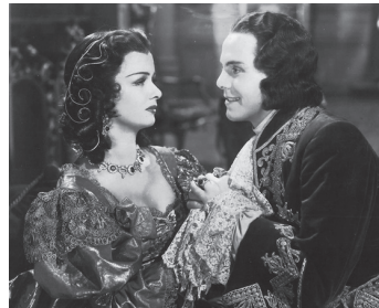
1939 L'HOMME AU MASQUE DE FER (The Man in the Iron Mask) de J. Whale avec Joan Bennett