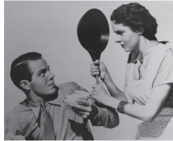
1936 À NEW YORK TOUS LES DEUX (The luckiest Girl i the World) d'E. Buzzell avec Jane Wyatt