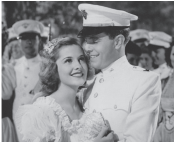
1938 LE DUC DE WEST POINT (The Duke of West Point) d'Alfred E. Green avec Joan Fontaine