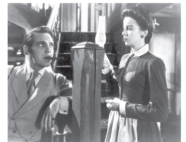
1941 LE CRIME D'ELLEN CREED (Ladies in Retirement) de V. Sherman avec Ida Lupino