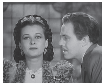
1940 LE FILS DE MONTE CRISTO (The Son of Monte Cristo) de R. V. Lee avec Joan Bennett