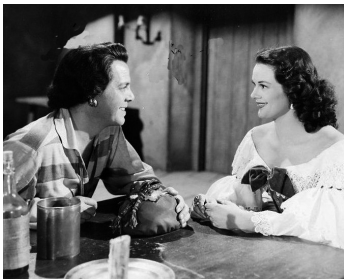
1950 FORTUNES OF CAPTAIN BLOOD de Gordon Douglas avec Patricia Medina