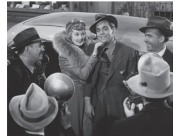
1940 CHANTEZ, DANSEZ, MES BELLES (Dance, Girl Dance) de D. Arzner avec Lucille Ball