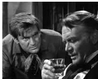
1967 CHUKA LE REDOUTABLE (Chuka) de Gordon Douglas avec Rod Taylor