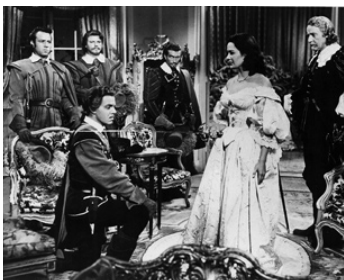
1952 LA FEMME AU MASQUE DE FER (Lady in the Iron Mask) de Ralph Murphy avec P. Medina