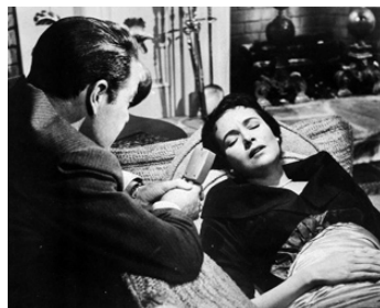
1956 THE SEARCH OF BRIDEY MURPHY de Noel Langley avec Teresa Wright