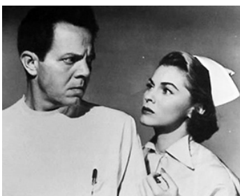
1954 DUFFY OF SAN QUENTIN de Walter Doniger avec Joanne Dru