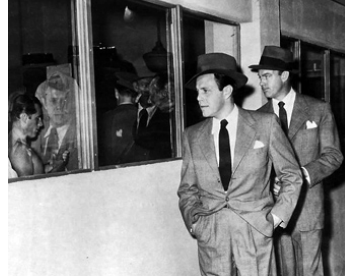
1948 LA GRANDE MENACE (Walk a crooked mile) de Gordon Douglas avec Dennis O'Keefe