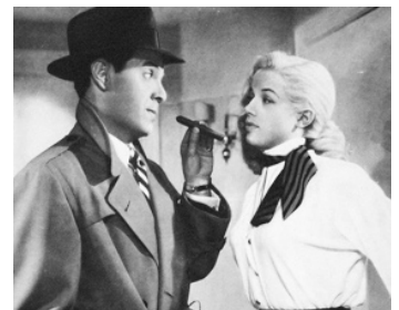
1953 LE SAINT DÉFIE SCOTLAND YARD (The Saint's Girl Friday) de Seymour Friedman avec Diana Dors