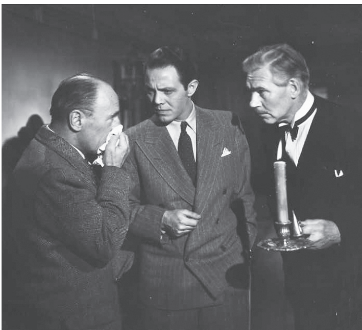
1945 LES DIX PETITS INDIENS (And then there were none) de René Clair avec Roland Young, Walter Huston