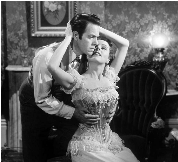
1949 AU FIL DE L'EAU (House by the River) de Fritz Lang avec Jane Wyatt