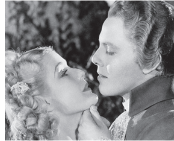
1936 ANTHONY ADVERSE (Anthony Adverse) de Mervyn LeRoy avec Anita Louise